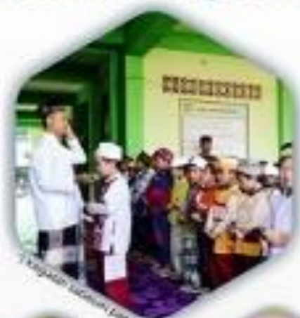
Foto-Foto Kegiatan Siswa